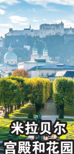
米拉贝尔 宫殿和花园