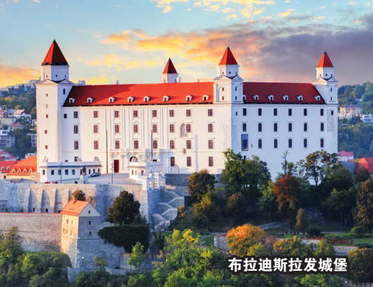
布拉迪斯拉发城堡