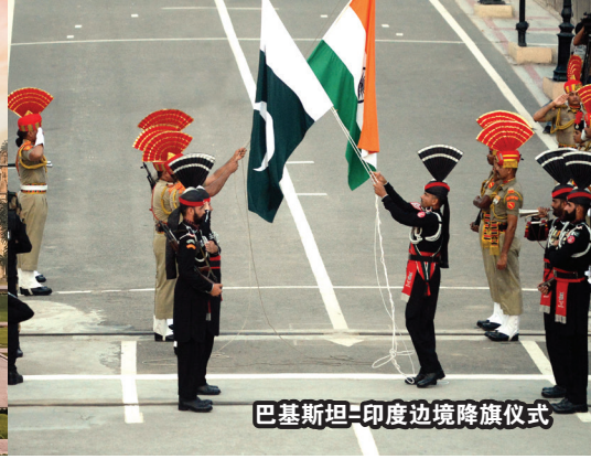
巴基斯坦-印度边境降旗仪式