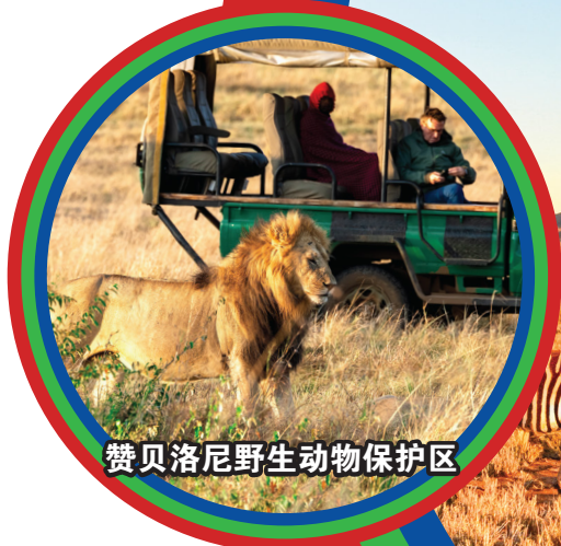
赞贝洛尼野生动物保护区