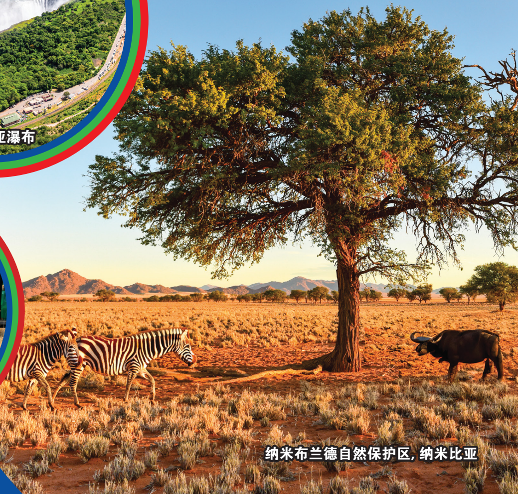
纳米布兰德自然保护区, 纳米比亚