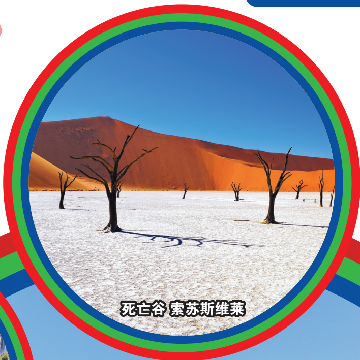
死亡谷 索苏斯维莱