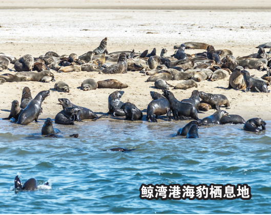
鲸湾港海豹栖息地