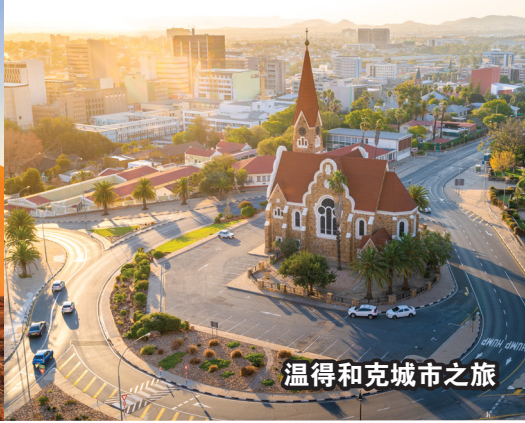
温得和克城市之旅