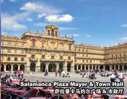
Salamanca Plaza Mayor & Town Hall 萨拉曼卡马约尔广场 & 市政厅