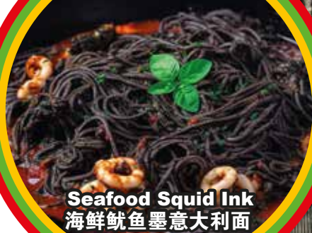
Seafood Squid Ink 海鲜鱿鱼墨意大利面