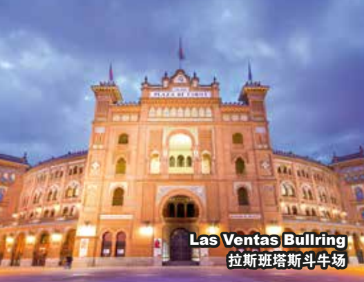
Las Ventas Bullring 拉斯班塔斯斗牛场