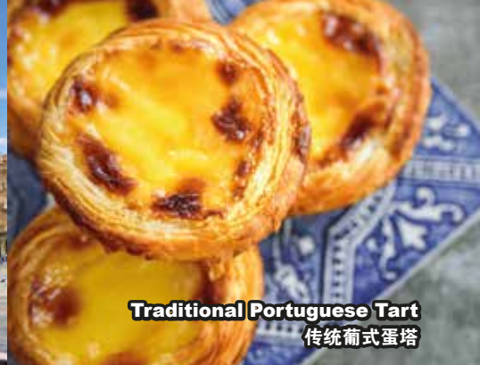
Traditional Portuguese Tart 传统葡式蛋塔