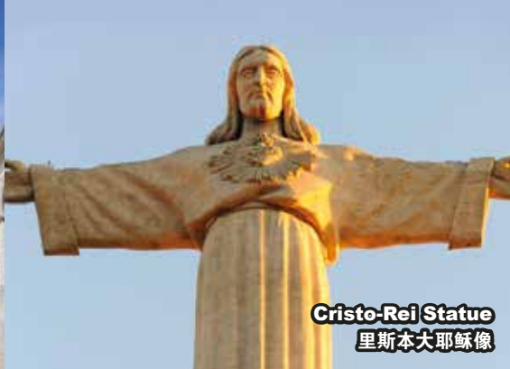
Cristo-Rei Statue 里斯本大耶稣像