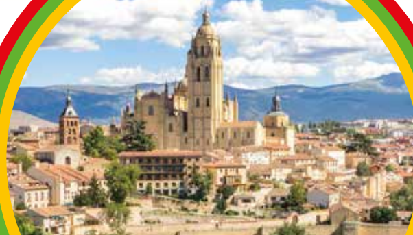
Segovia Cathedral 塞哥维亚主教座堂