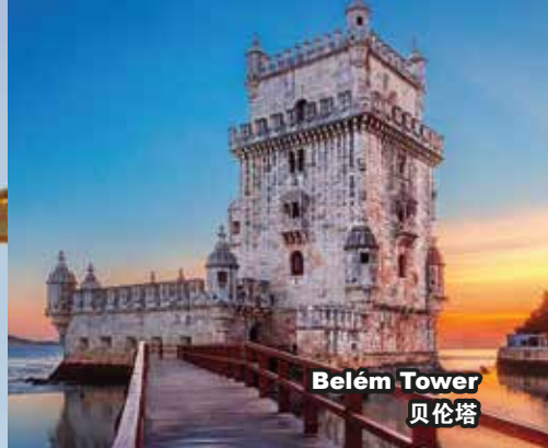
Belém Tower 贝伦塔