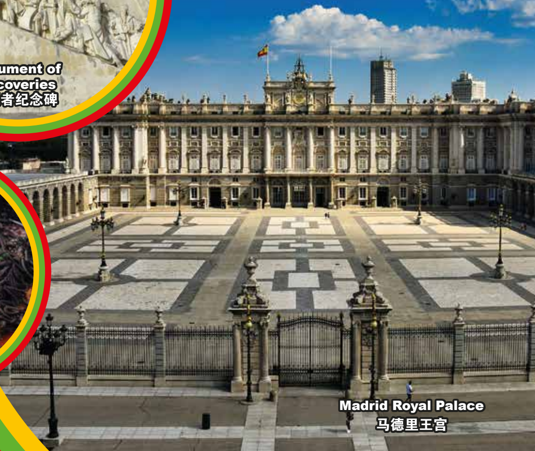
Madrid Royal Palace 马德里王宫