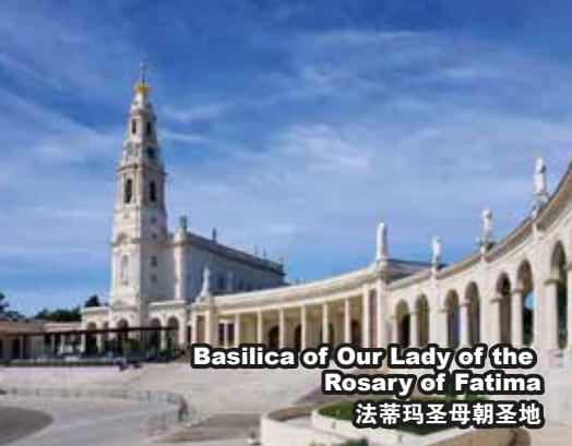
Basilica of Our Lady of the Rosary of Fatima 法蒂玛圣母朝圣地