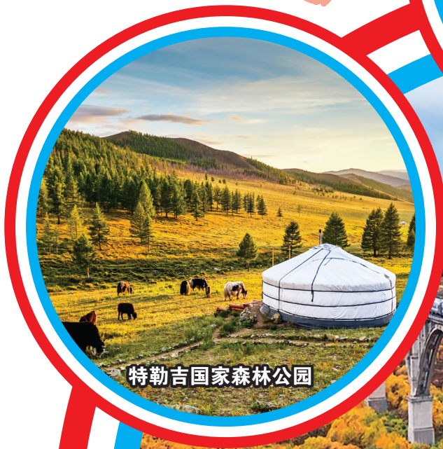
特勒吉国家森林公园