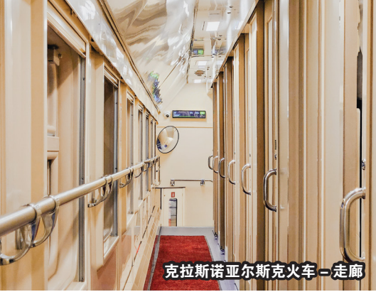
克拉斯诺亚尔斯克火车—走廊