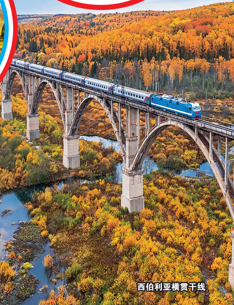
西伯利亚横贯干线