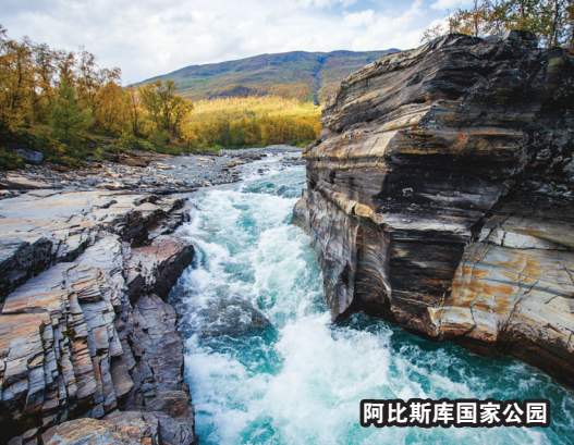
阿比斯库国家公园