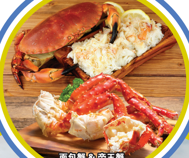
面包蟹 & 帝王蟹