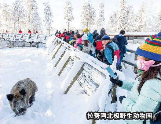
拉努阿北极野生动物园