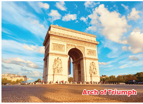
Arch of Triumph