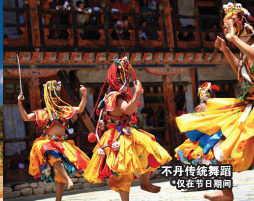
不丹传统舞蹈 *仅在节日期间