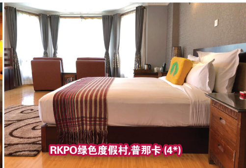
RKPO绿色度假村,普那卡(4*)