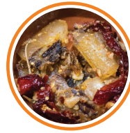
香辣牛肉 / 香辣猪肉