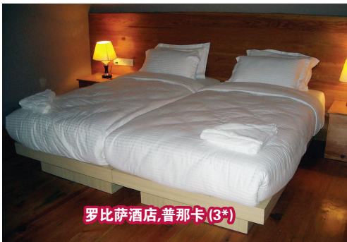
罗比萨酒店,普那卡(3*)