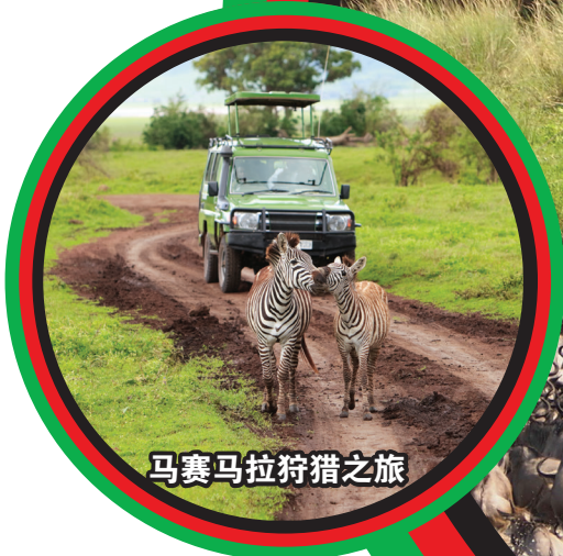
马赛马拉狩猎之旅