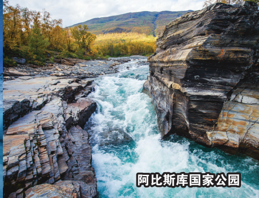
阿比斯库国家公园