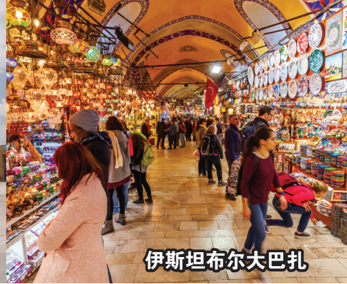
伊斯坦布尔大巴扎