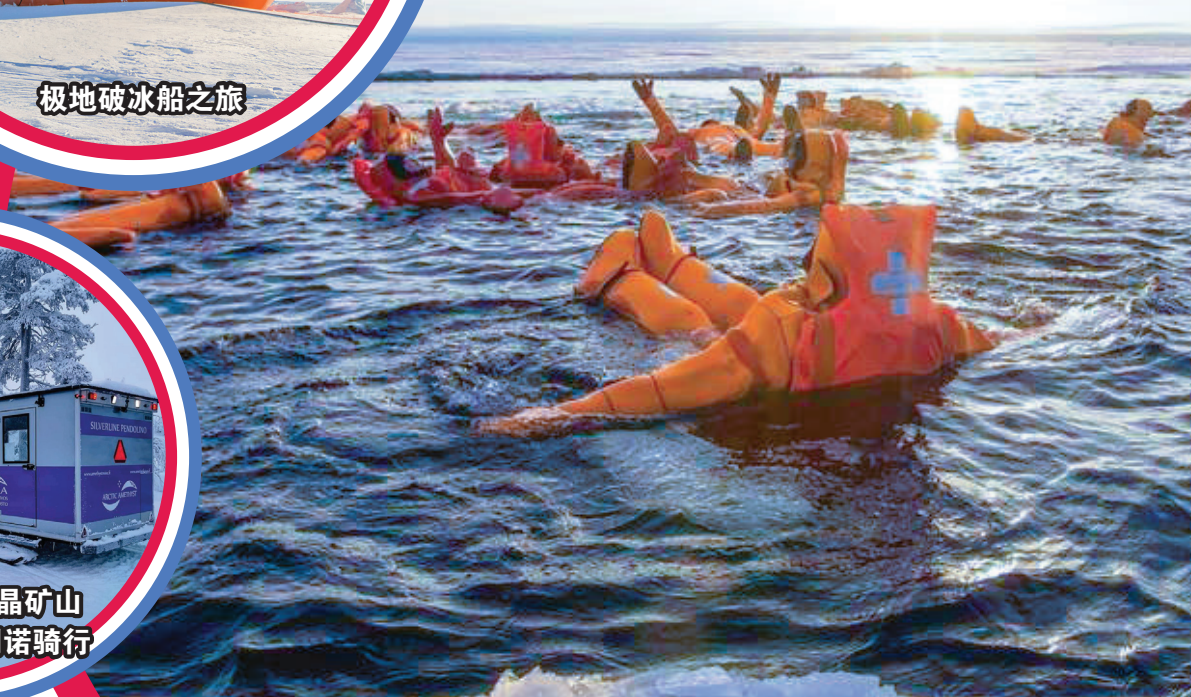
极地破冰船之旅 (体验)