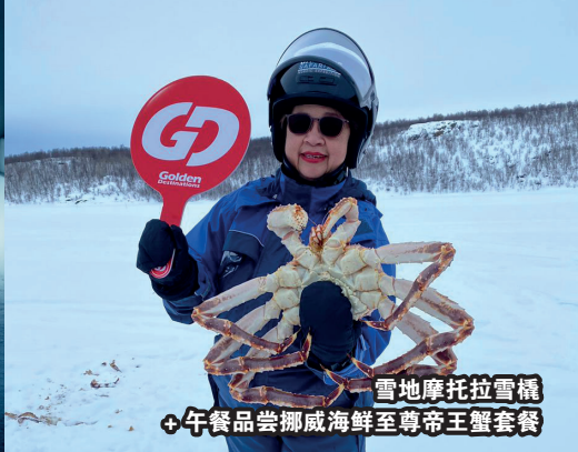
雪地摩托拉雪橇 +午餐品尝挪威海鲜至尊帝王蟹套餐