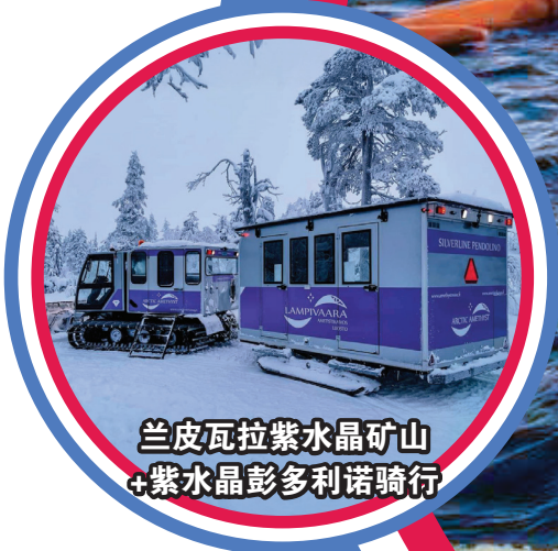
兰皮瓦拉紫水晶矿山 + 紫水晶彭多利诺骑行