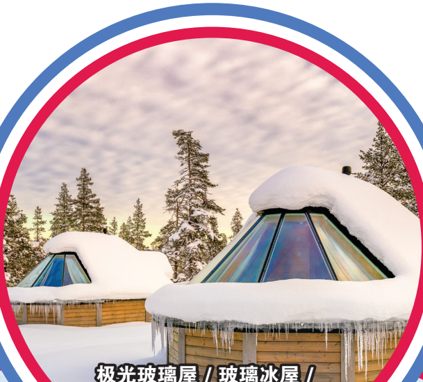
极光玻璃屋 / 玻璃冰屋 / 摩登设计冰屋 // 豪华极光玻璃屋 / 摩登设计落地玻璃别墅 (1晚)