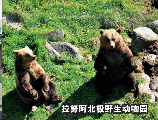
拉努阿北极野生动物园