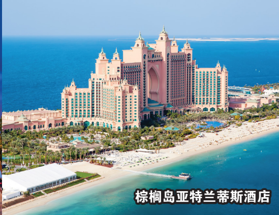
棕榈岛亚特兰蒂斯酒店