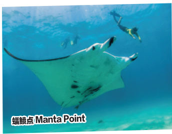
蝠鲼点 Manta Point