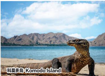
科莫多岛 Komodo Island