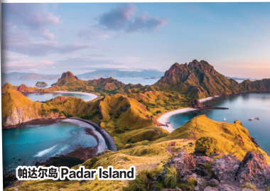
帕达尔岛 Padar Island