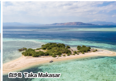
白沙岛 Taka Makasar